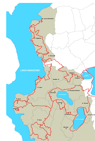
Il sistema delle Vie Verdi dei Laghi

Agenda21Laghi ha realizzato un sistema di itinerari ciclo-pedonali interamente segnalati e documentati, le Vie Verdi dei Laghi (VVL).